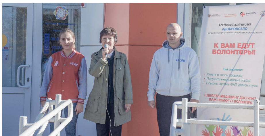
Открытие акции «#ДоброВСело»