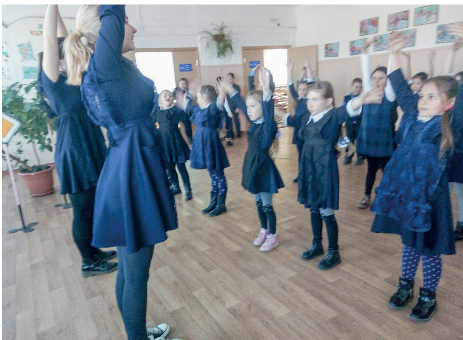
Спортивные перемены в Тарбагатайской средней школе проводят волонтеры

В моем кружке занимаются дети с 14 лет. Постоянного состава нет, кто-то ходит с самого начала и до выпуска из школы, а кто-то теряет интерес и уходит, дети пробуют себя в разных направлениях. Кружок посещают 20 человек. Глядя на то, как наши малыши из начальной школы, «уткнувшись в телефоны», сидят на переменах, ребята решили проводить спортивные перемены, а это и пропаганда здорового образа жизни. Также активно участвуем в экологических акциях, например, акция «Чистое село», «360 минут для Байкала» и др. Приятно, когда местный лесхоз приглашает нашу группу на посадки леса. «Очень приятно осознавать, что ты ПОСАДИЛ ЛЕС!!!» – многозначительно говорят дети. А еще мы провели акцию среди дошколят и первоклассников «Лес на подоконнике», ребята посадили семена сосны и ухаживают за саженцами. Также помогаем приюту для жи-