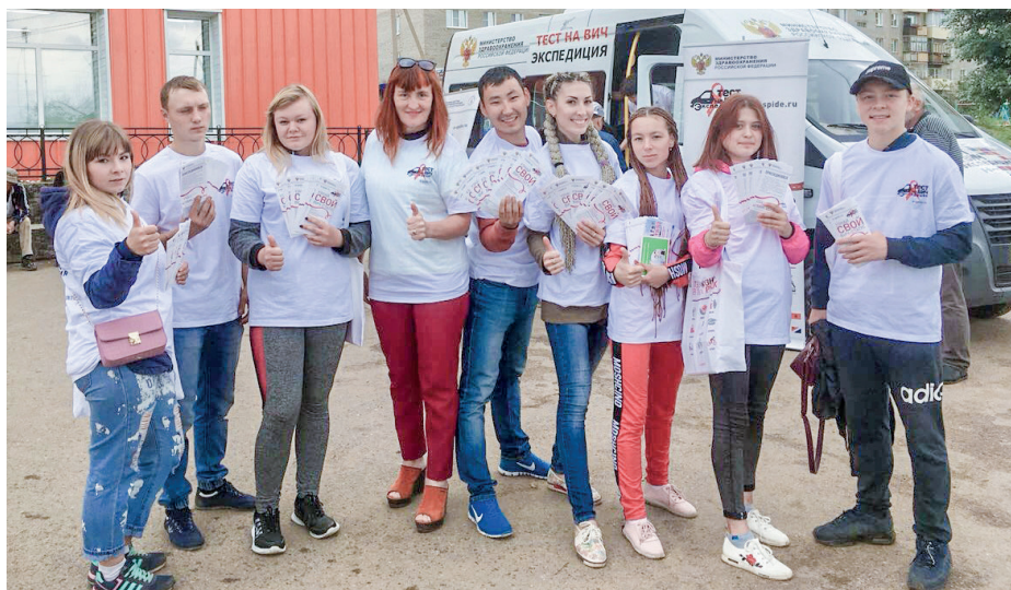
Волонтерская группа «Селенга» участвовала во Всероссийской акции «Тест на ВИЧ: Экспедиция»