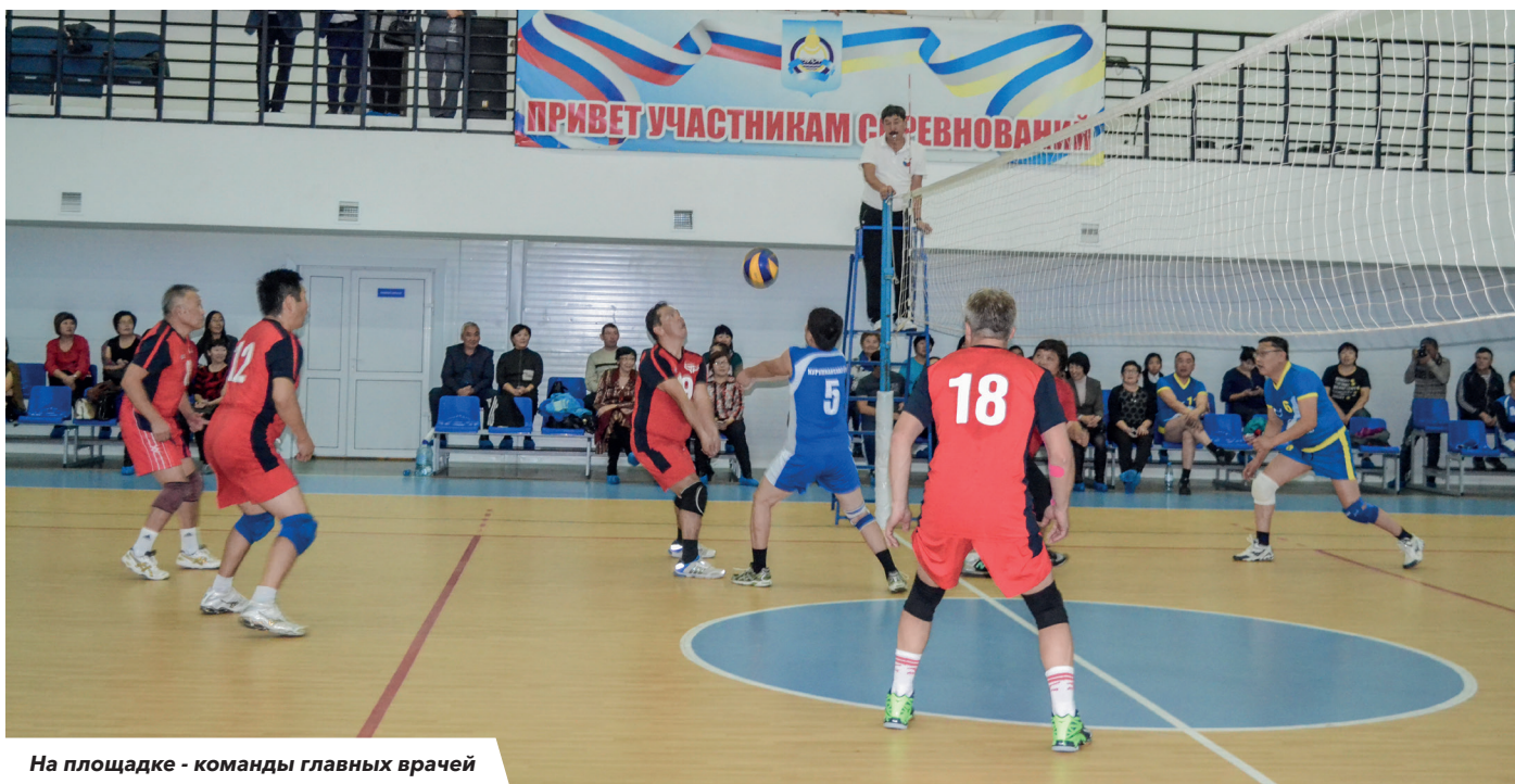
На площадке - команды главных врачей