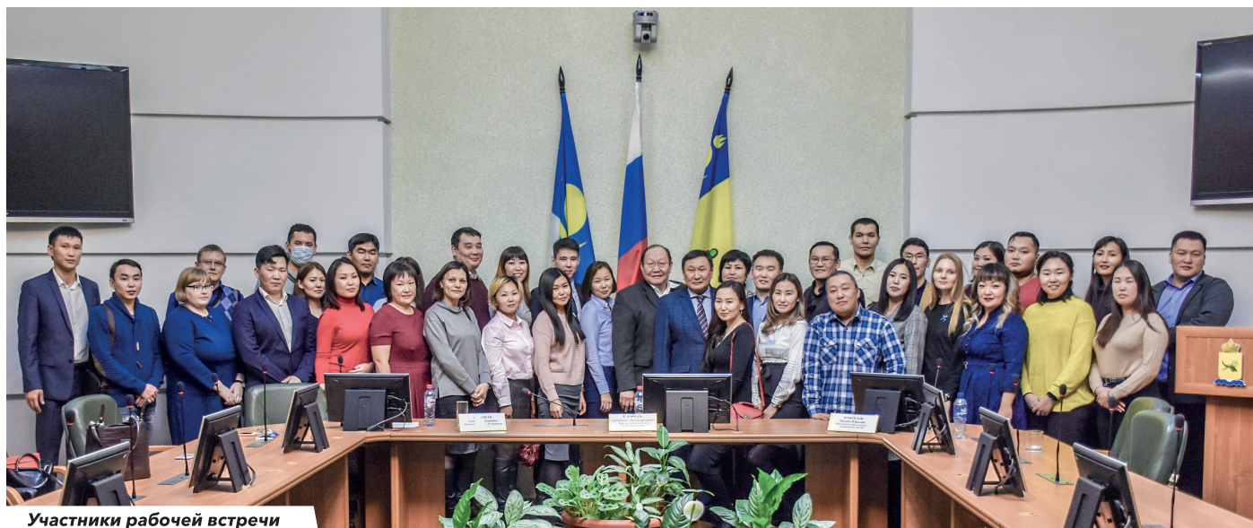
Участники рабочей встречи